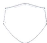
Vista de frente

Identificação do tamanho: adulto / criança